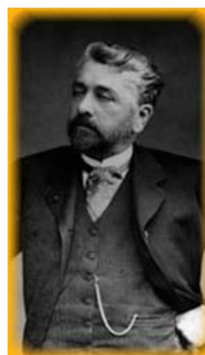
Alexandre Gustave Eiffel

Il Presidente francese FranVois-Felix Faure , il quale si era impegnato per la realizzazione e l'organizzazione delle Olimpiadi a Parigi , si spense un anno prima il grande avvenimento. Il suo successore, Emile Loubert , in contrasto con le idee di Faure, concentrò tutta la sua attenzione su un altro grande evento , ritenuto da lui più importante e redditizio: la III Esposizione Universale , relativa alle scoperte scientifiche e tecniche che avevano caratterizzato il XIX Secolo, in onore quale venne innalzata, per conto dell'ingegner Alexandre Gustave Eiffel , una immensa torre metallica, oggi simbolo di Parigi . Le Olimpiadi parigine finirono così per diventare soltanto un piacevole, quanto bizzarro, passatempo per le persone accorse all'Expo. Tutte le promesse fatte da Faure sulla realizzazione di impianti sportivi adatti ad ospitare le gare, non furono naturalmente mantenute e, alla vigilia della seconda edizione olimpica, niente era pronto per accogliere atleti e semplici spettatori.