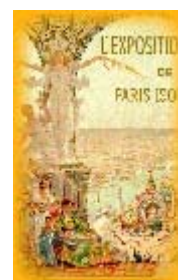
Manifesto dell'Exposition Universale

Se le Olimpiadi di Atene avevano riaperto gli animi degli sportivi di tutto il mondo, che pensavano di assistere alla nascita di una nuova era per lo sport internazionale, a Parigi la speranza di veder rifiorire un così prestigioso evento, per secoli seppellito insieme agli antenati che lo avevano ideato, ripiombò nel buio più totale. Quello che doveva essere il più grande avvenimento all'alba del XX Secolo, si trasformò ben presto in un piccolo germoglio spuntato all'ombra di una grande quercia.