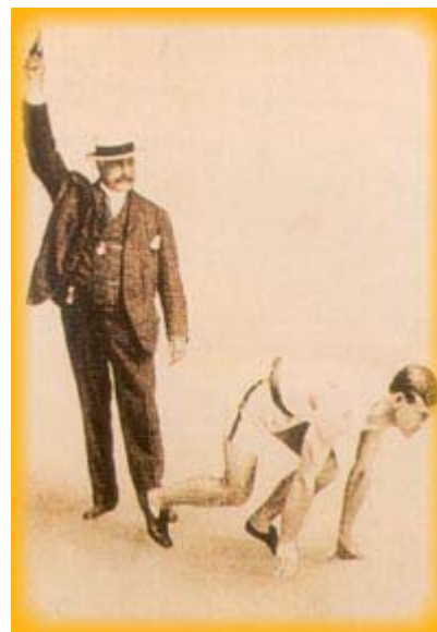
Archie Hahn, primatista dei 200 m.

Pronto ad appoggiare i giochi, Roosevelt decise di lasciare a St. Louis questo onore . Così, per la seconda volta, le Olimpiadi fecero da intrattenimento ad un'altra manifestazione, questa volta la "Louisiana Purchase Exposition", con le catastrofiche conseguenze già viste in quella di Parigi. Sulla scia dei francesi, gli americani riuscirono a fare addirittura peggio: vennero elargiti 390 titoli