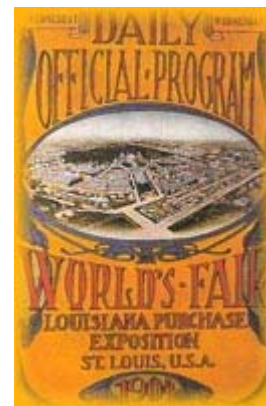
Poster del 1904

Gli "orrori" commessi durante l'edizione di Atene prima e quella di Parigi poi, non furono sufficienti per decretare la fine delle Olimpiadi. Un lume di speranza si accese nell'animo di de Coubertin, convinto che gli Stati Uniti sarebbero potuti arrivare dove gli altri avevano fallito: fare dei giochi olimpici un evento sportivo internazionale di tutto rispetto . Egli sperava infatti che gli americani sarebbero riusciti ad avere quell'organizzazione che agli altri era mancata. Egli si sentiva inoltre in debito con questa nazione, la cui partecipazione ai giochi aveva dato un senso sportivo alle edizioni precedenti, grazie ai suoi eccellenti atleti.