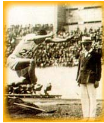
Il giapponese Mikio Oda, oro nel salto in lungo

Un altro nobile fu protagonista dell'edizione olandese dei giochi. Il principe Olav di Norvegia e futuro re si aggiudicò la classe dei 6 metri nella vela sullo scafo Norma, pilotato dal grande timoniere Johan Anker. Uscito