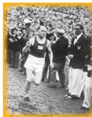
Paavo Nurmi mentre porta la torcia olimpica

I finlandesi se la cavarono comunque molto bene di fronte alla volontà dei russi, dei cecoslovacchi, dei polacchi, dei bulgari, dei romeni e degli ungheresi di alloggiare in un villaggio separato, con tanto di recinzione fatta di filo spinato, per impedire agli estranei di intrufolarsi nelle abitazioni, ma soprattutto per ostacolare la fuga degli atleti verso il mondo capitalistico . Ma alla fine la sportività degli atleti prevalse su qualsiasi conflitto politico : nei 3.000 siepi l'ucraino Vladimir Kazantsev abbracciò pubblicamente il giovane agente della Fbi, Horace Ashnfelter, dopo essere stato da egli battuto in finale; portati in trionfo dai sovietici, anche il pastore volante, Bob Richard, che si aggiudicò l'oro nell'asta, e Mal Whitfield, da poco rientrato dalla guerra di Corea, che fa il bis negli 800 metri.