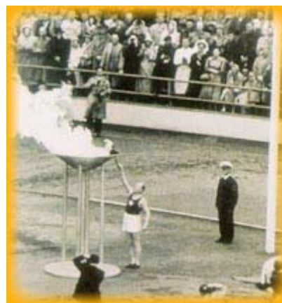
Paavo Nurmi accende la fiamma olimpica

Ad assistere ai giochi di Helsinki, la cui inaugurazione avvenne il 19 luglio del 1952 , accorse una miriade di gente da tutto il mondo, che rimase ammaliata dall' apparizione nello Stadio del cinquantacinquenne Paavo Nurmi, ultimo tedoforo, che consegnò il tripode al sessantatreenne finlandese Hannes Kolehmainen, il quale accese la fiamma simbolo dei giochi .