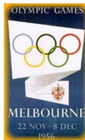
Poster dei giochi olimpici

La Germania Ovest e la Germania Est furono obbligate a sfilare e partecipare come un'unica squadra , cosa che venne ripetuta soltanto nelle due seguenti edizioni.