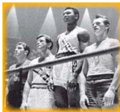
Casius Clay, vincitore nella categoria dei mediomassimi

L'unico contrattempo durante la sfilata venne creato dalla Cina popolare che, per protestare contro la partecipazione alle Olimpiadi della Cina nazionalista, sostituì il vessillo con un cartello recante la scritta - Under protest - sotto protesta.