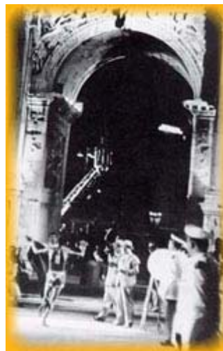
Abebe Bikila, vincitore della maratona entra all'Arco di Costantino

Incredibilmente quattro concorrenti nel salto in lungo riuscirono a battere il record impresso da Jesse Owens ventiquattro anni prima, andando a saltare oltre gli otto metri. A vincere la gara fu Ralph Boston con 8,12 metri . Nell' alto sorprese invece la vittoria del georgiano Robert Shavlakadze , che volò più su dei favoriti John Thomas e Valery Brumel. Mentre fra le donne fu la rumena Jolanda Balas a saltare più in alto delle altre