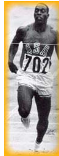
Robert Hayes (USA), primo a correre i 100m in 10 secondi

Le gare veloci furono invece dominate dalla " freccia nera ", Robert Hayes , che nei 100 metri a Tokyo segnò un tempo di 10"06 , su una pista resa rovinata dalla pioggia e dalle tracce dei marciatori partiti poco prima. Egli fu inoltre protagonista di una grandissima rimonta sul francese Jocelyn Delecour nella staffetta, che lo vide tagliare per primo il traguardo. Al termine delle Olimpiadi Hayes preferì lasciare l'atletica per darsi al più ricco football americano.