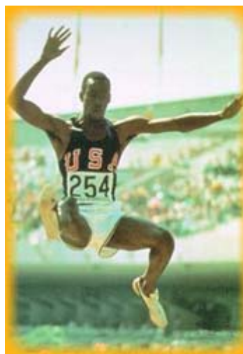
Bob Beamon batte il record mondiale in salto in lungo 8,90 m

A convincere gli altri atleti a partecipare all'Olimpiade fu il grande carisma del ventinovenne Ralph Boston , primatista mondiale nel salto in lungo, nonché oro a Roma e argento a Tokyo, che vedeva nei sacrifici fatti in allenamento un buon motivo per non rinunciarvi. Ma le manifestazioni di protesta non mancarono durante le competizioni: alla premiazione dei 200 metri piani, il vincitore Tommie Smith ed il terzo classificato, suo connazionale, John Carlos, si presentarono senza scarpe, con delle calze nere ai piedi , e al momento in cui venne innalzata la bandiera a stelle e strisce i due statunitensi alzarono il braccio con il pugno chiuso coperto da un guanto nero e abbassarono la testa . Questo gesto