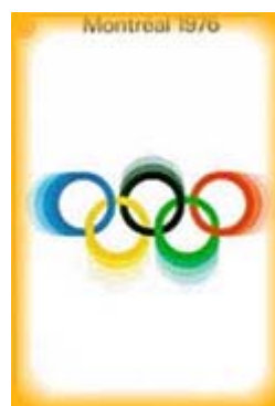
Poster dei giochi olimpici

Le Olimpiadi di Monaco avevano lasciato un segno impossibile da cancellare, perché scritto con il sangue degli undici atleti israeliani morti nell'attentato palestinese. Ma in questa edizione il nuovo presidente del CIO, l'irlandese lord Killanin , si trovò ad affrontare un grande problema legato alla politica, che mai prima di allora aveva tanto condizionato i Giochi da limitarne le presenze e i risultati: il 17 luglio 1976 , giorno di apertura della XXI Olimpiade, ben ventisei paesi africani - tutti tranne Senegal e Costa d'Avorio - boicottarono la sfilata e annunciarono il loro ritiro a causa della mancata espulsione della Nuova Zelanda , accusata di intrattenere rapporti sportivi con il Sud Africa, nazione razzista. Uniti alla protesta nera, Iraq e Guyana decisero per solidarietà di disertare i Giochi .