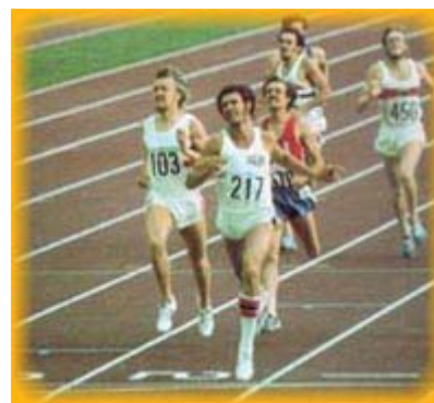
Il cubano Alberto Juantorena, vincitore nei 400 e 800m