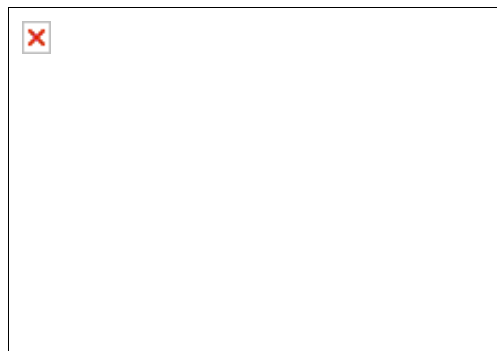
L'italiana Sara Simeoni vincitrice nel salto in alto con 1,97

Meno fortunato fu invece il sovietico Vladimir Lapisky , che rimase quasi ucciso nella semifinale di fioretto a squadre contro la Polonia: il fioretto riuscì a penetrare il giubbotto protettivo di Lapisky, ma fortunatamente non gli recise nessun organo vitale. Nonostante la disgrazia l'URSS passò il turno, ma perse in finale con la Francia e si dovette accontentare dell'argento.