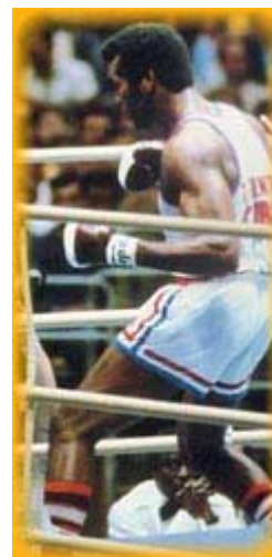
Teofilo Stevenson: pugile cubano al suo terzo oro consecutivo