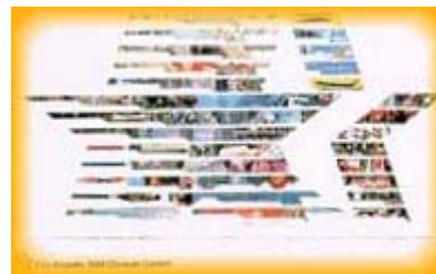
Poster dei giochi olimpici