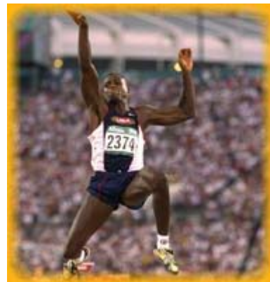
Carl Lewis nel salto in lungo

Grande protagonista dei Giochi e in piscina fu la