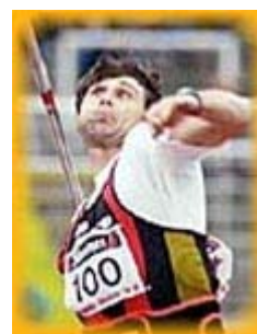
Jan Zelezny, lancio del giavellotto

Il britannico Linford Christie, dominatore dei 100m