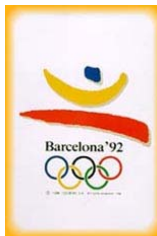
Poster dei giochi olimpici

Dopo trentadue anni di isolamento tornò a sfilare il vessillo del Sud Africa che aveva finalmente posto fine al regime apartheid. Fece il suo ritorno anche Cuba, assente a Los Angeles e a Seul. Al loro debutto olimpico invece gli stati di Namibia e Yemen.