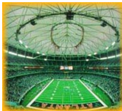
Georgia Dome, luogo del torneo olimpico di Basket del 1996